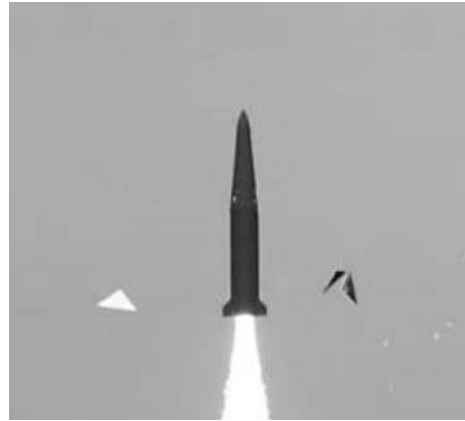
รูปที่ 7 ตัวอย่างจรวด Hyunmoo

จากหัวข้อข้างต้น สามารถพิจารณาได้ว่า การวิจัยและพัฒนาเทคโนโลยีจรวดและอาวุธปล่อยนำวิถีของแต่ละประเทศมีแนวโน้มที่คล้ายกันด้านหนึ่ง คือ เป็นการพัฒนายุทโธปกรณ์เพื่อตอบสนองความต้องการเฉพาะเหล่าทัพและหลักนิยมที่แต่ละประเทศใช้ อาทิ