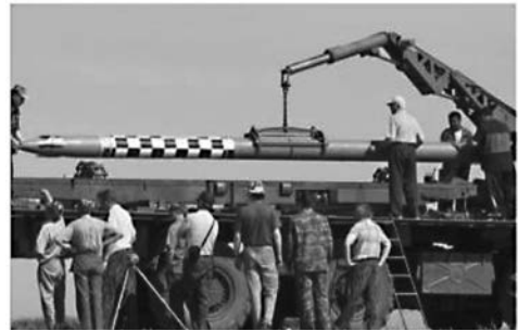
รูปที่ 4 ตัวอย่างจรวด Tornado-S