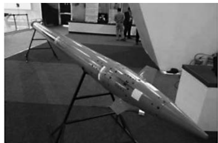
รูปที่ 5 ตัวอย่างจรวด Pinaka