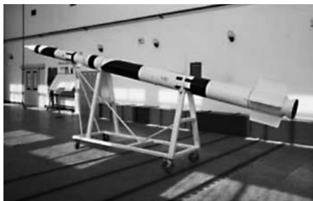
รูปที่ 3 ตัวอย่างจรวด A200