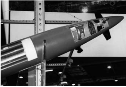
รูปที่ 1 ส่วนประกอบหัวรบ GMLRS

แบบ Shaped Trajectory เพื่อเพิ่มระยะยิงโดยไม่ต้องใช้เพดานบินสูงและเลือกใช้จรวดที่มีระยะยิงได้ถึง 300 กม. [2]