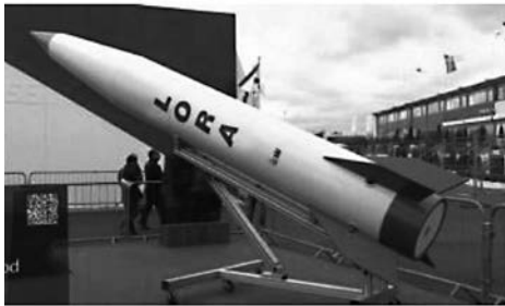
รูปที่ 2 ตัวอย่างลูกจรวด LORA

แบบ Shaped Trajectory เพื่อเพิ่มระยะยิงโดยไม่ต้องใช้เพดานบินสูงและเลือกใช้จรวดที่มีระยะยิงได้ถึง 300 กม. [2]