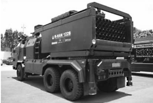
รูปที่ 6 ชุดยิงจรวด R-Han